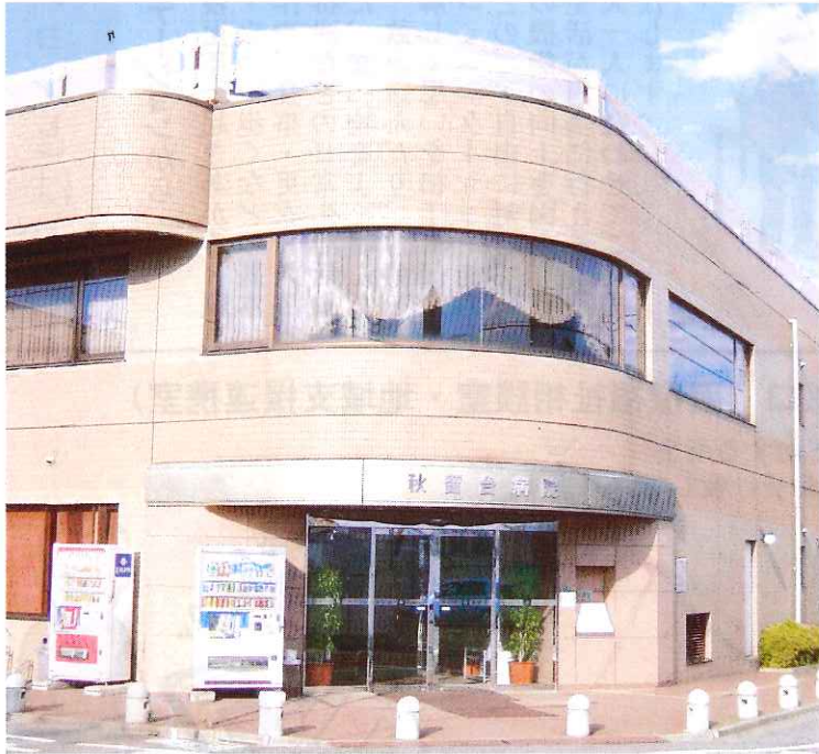
[ あきる台病院正面玄関 ]