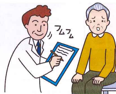
【お気軽にご相談下さい】